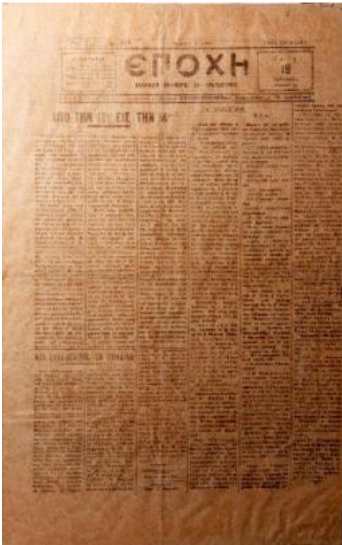
19.1.1921 Tarihli YAŞ Gazetesi