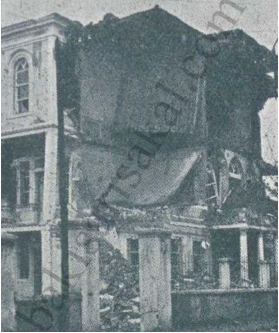
Deprem Sonucunda Çarşamba Hükümet Konağı