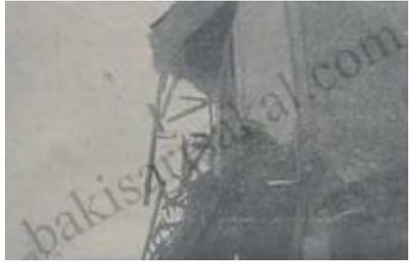
Arasta Caddesinde Harap Olan Bir Ev