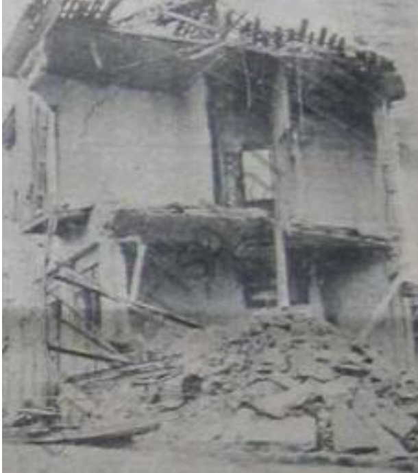
Samsun’da Ziraat Bankası’nın Karşısında Bulunan Ev

Bahçelerde en tanınmış zenginlerden, en fakir insanlara kadar herkes şiltesini, paltosunu yere sermiş, pek şiddetli bir şekilde taarruz eden tabiat hadisesinin yeni bir hücumda bulunup bulunmayacağı noktalarında mütereddit bekliyorlardı.