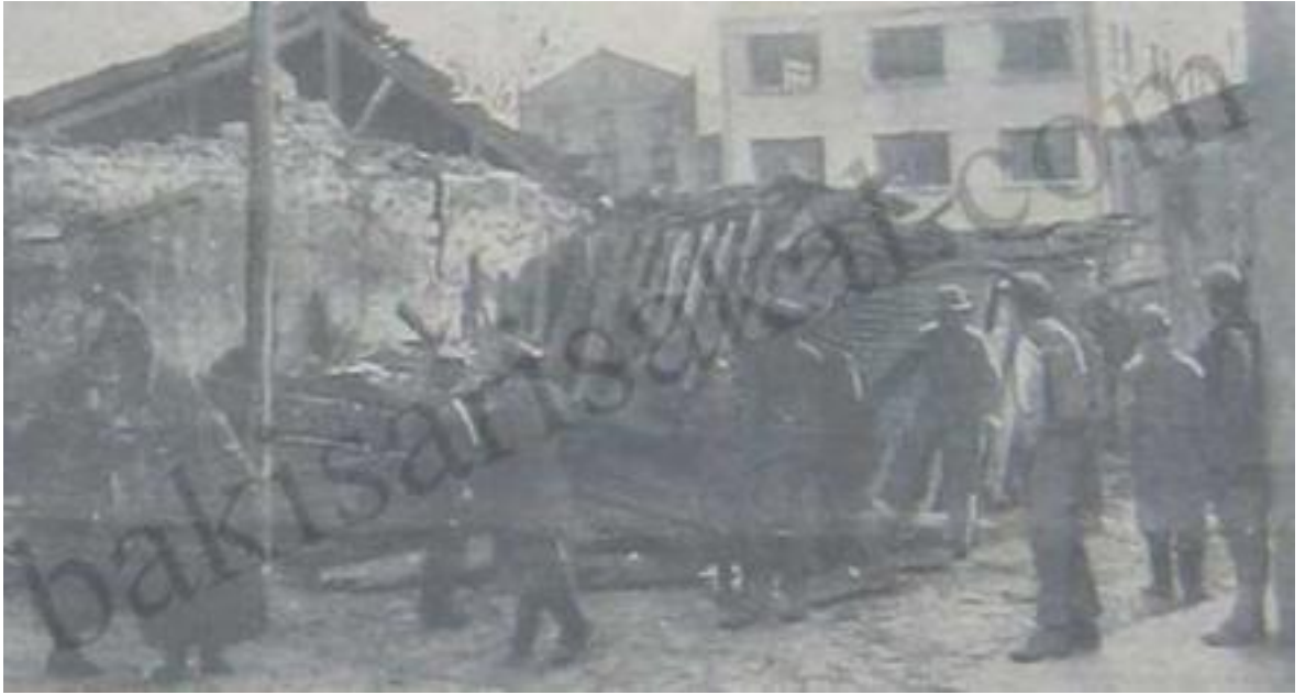
Depremden Tamamen Çöken Bir Binanın Enkazı Kaldırılıyor