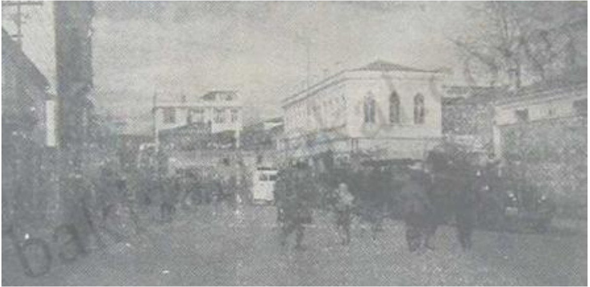
Samsun'da İtfaiye ve Kızılay Otomobilleri Depremden Yıkılan Evlere Doğru Hareket Ediyorlar