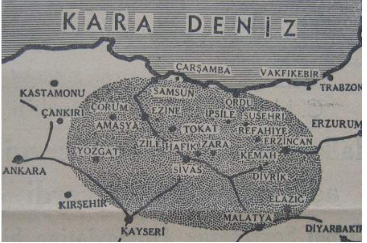
Depremın Tahribatından Etkilenen Mıntıkayı Gösterir Harita