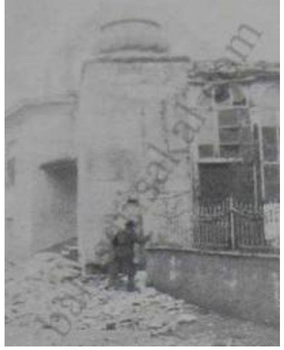
Samsun’da Deprem Sonucu Minaresi Yıkılan Pazar Cami