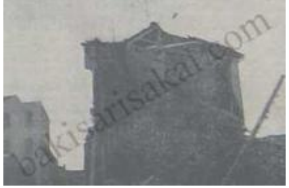
Samsun'da Yıkılan Binalardan Biri