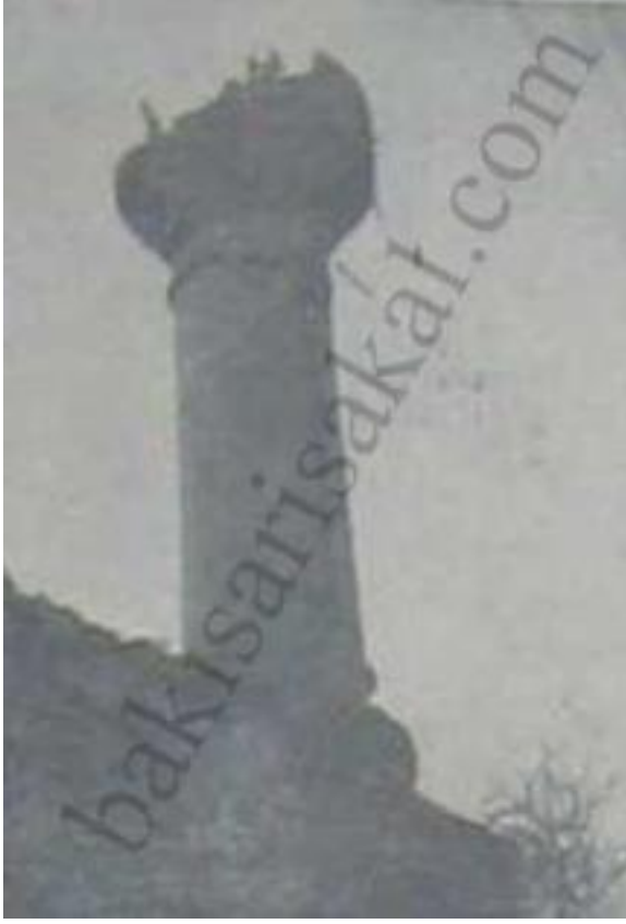
Samsun'da Hacı Hatun Camisinin Yıkılan Minaresi (Bu minare 400 Seneliktir ve Samsun'un İlk Minareli Camiidir.