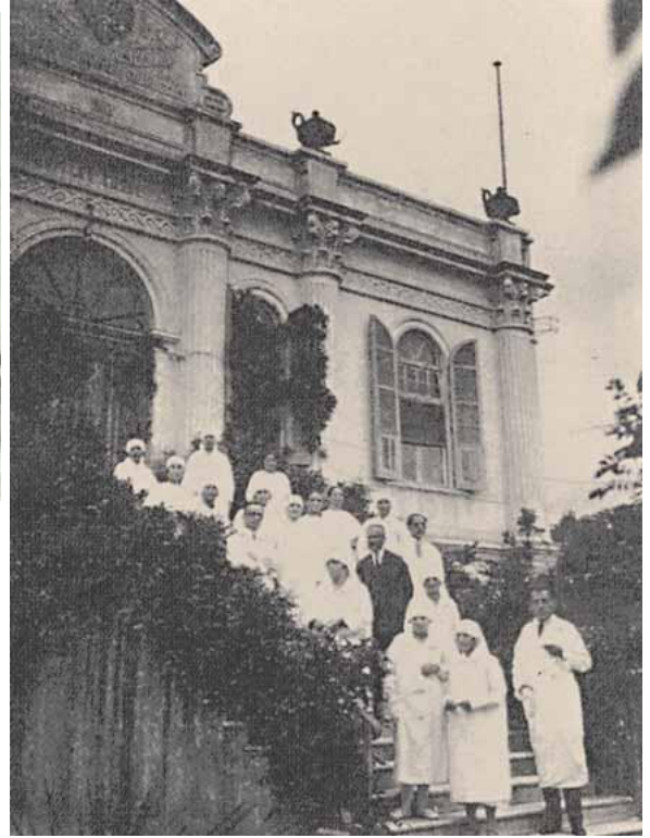
Selanik Rus Hastanesi Çalışanları