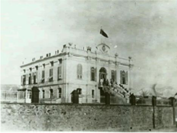
Selanik’te Açılan Rus Hastanesi

“ Üççeşmeler’de yeniden inşa olunan Rus Hastanesinin resmi küşadı 5 Şubat 1910 günü pek büyük bir debdebe ile icra olundu. Resmi küşada Selanik’te sakin bilcümle kibar Rus tebaası ispatı vücud edip Vali İbrahim Bey, Üçüncü ordu Kumandanı Hadi Paşa, Erkan-ı Harbiye Reisi Ali Rıza Bey, Rum Metropolidi Aleksandros Efendi, Bulgar ve Sırp rüesai ruhaniyesi ve düveli ecnebiye konsolosları hazır bulunmuşlardır.