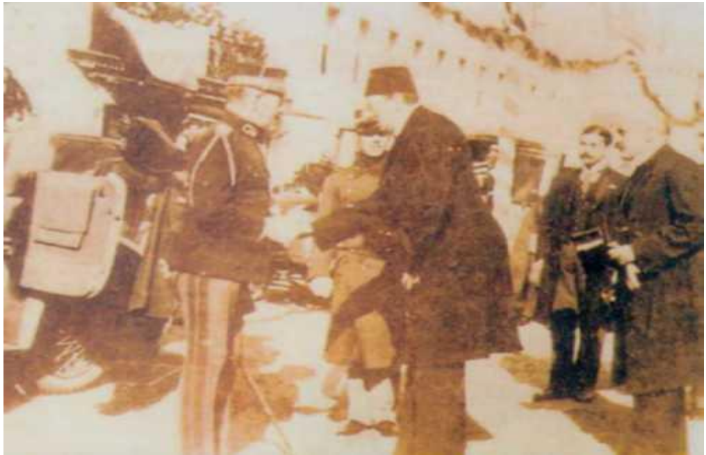
Belediye Başkanı Osman Sait Selanik’te 1913 Yılında Kral Konstantin’le

Osman Sait Bey cevaben: Umumi Valilikten aldığı bir mektupta şehrin yeni planına dahil olmaları hasebiyle arsalar için artık ruhsatname ita etmemesinin tavsiye edildiğini belediye devairine bu yolda talimat ita eylediğini bildirdi. Hadise bu suretle kapatılmıştır. 6