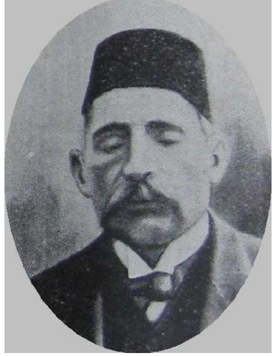
Yusuf Kapancı Efendi