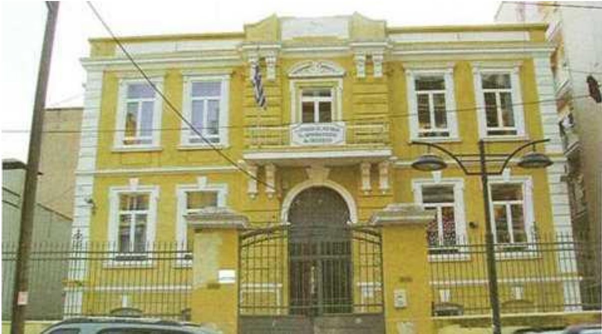
Terakki Mektebinin Selanik'teki Binası Günümüzde de Okul Olarak Hizmet Vermektedir

Okul günümüzde Şişli Terakki Lisesi olarak eğitim öğretimine devam etmektedir.