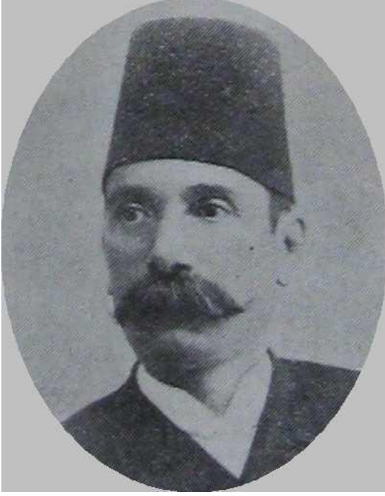
Tütüncü Hasan Akif Efendi