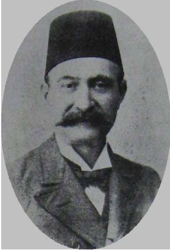
Şekerzade Rifat Efendi