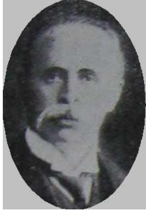
Ahmet Kapancı Efendi