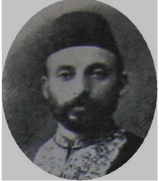
Konsolos Abdi Efendi

27 Mart 1880 tarihinde okulun adı Selanik Terakki Mektebi olarak değiştirildi ve ortaokuldan sonra lise düzeyinde de eğitim vermeye başladı.