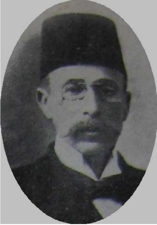
Şekerzade İzzet Efendi