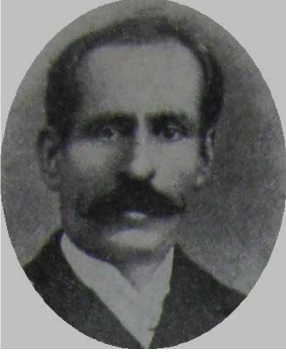
Refik Recep Efendi